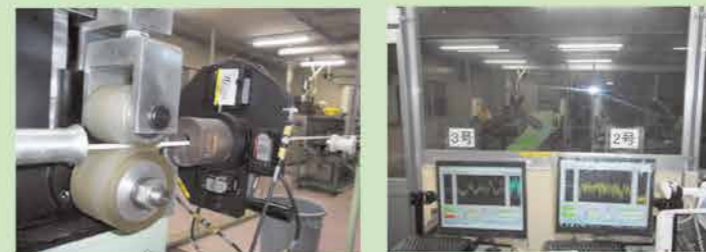
レーザーセンサーによるストロー外径測定 リアルタイムモニターでオペレーティング