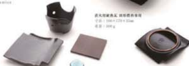
直火用耐熱瓦 四角器用専用 寸法：160×120×25mm 重量：300g