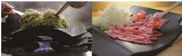
耐熱瓦 楕円器用 寸法：210mm×250×20mm (10A仕様 楕円器専用) 重量：1kg