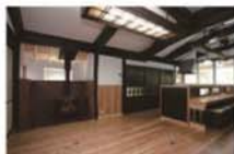
弊廠 / 鳥取県新田市長沢町 耐熱性に富んだ石州瓦をベースの既設等の インテリアに取り入れることで和モダンな空間 を演出。瓦の質感と色合いは屋根瓦外にも活用し ています。

〒697-0023 鳥取県新田市長沢町7-3-6 TEL: 0855-22-1807 FAX: 0855-23-0622 E-mail: honkimachi@iwamicatv.jp