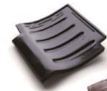
直火用耐熱瓦 100枚 寸法：220×200×20mm (10A仕様) 重量：2,200g